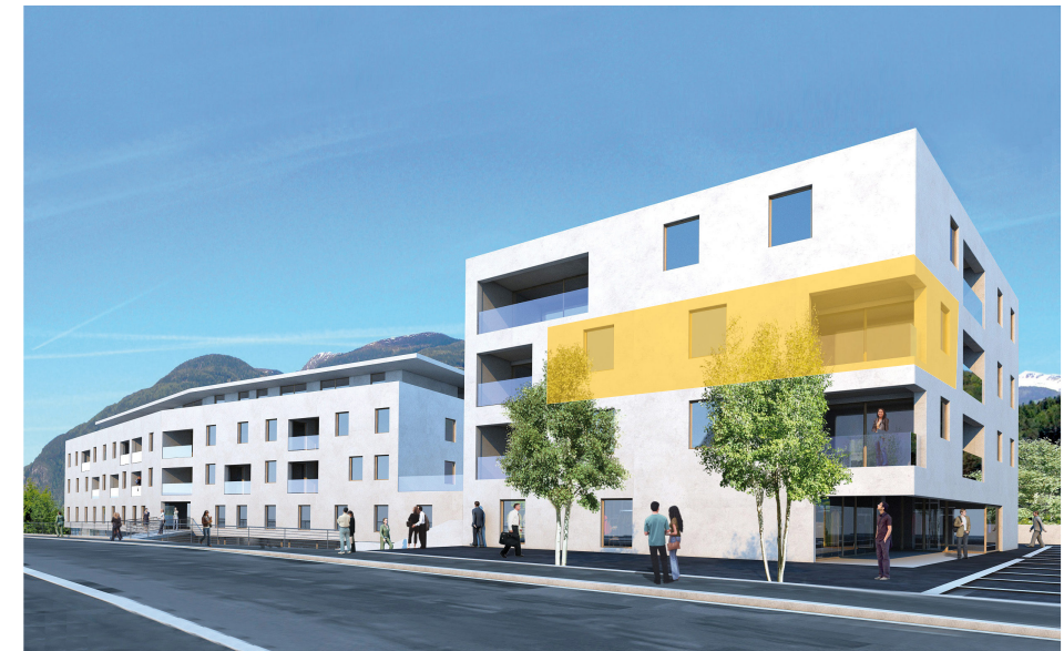
Ansicht Süd Prospetto sud