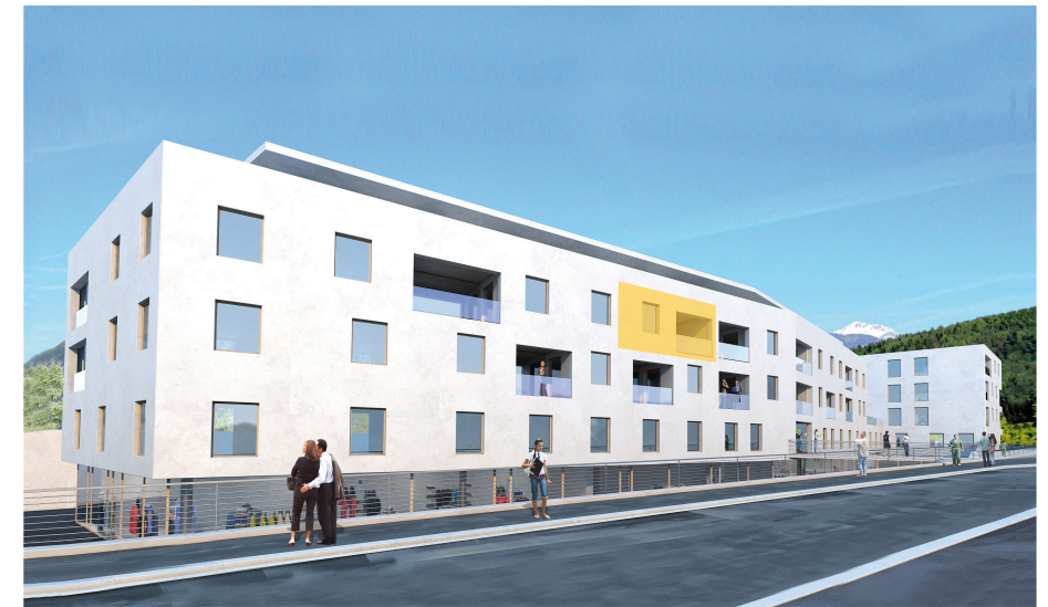
Ansicht Süd Prospetto sud