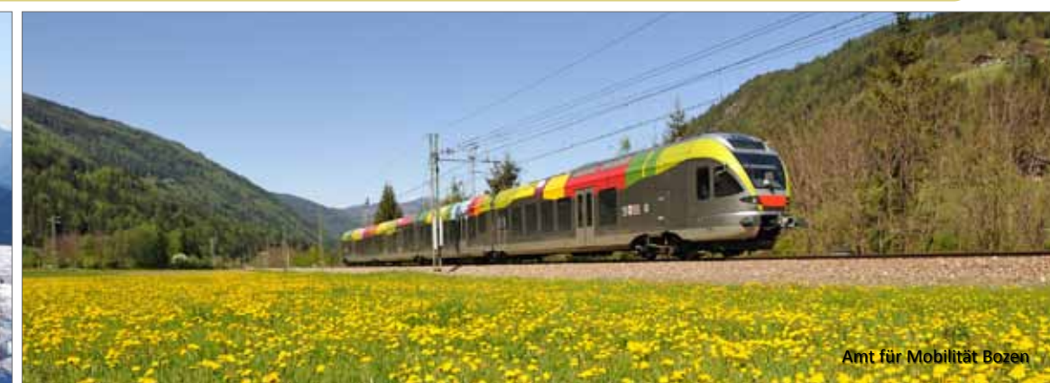
Amt für Mobilität Bozen